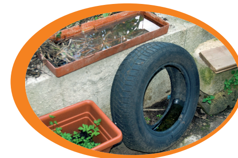
Evita di abbandonare i pneumatici e di far ristagnare l'acqua