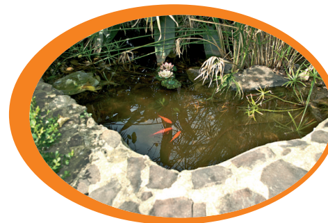
Tieni pulite fontane e vasche ornamentali, eventualmente introducendo pesci rossi (predatori di larve di zanzare)