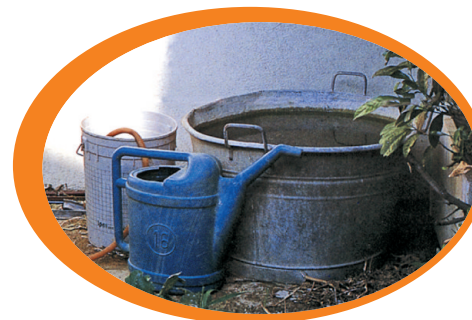
Non lasciare gli annaffiatori e i secchi con l'apertura rivolta verso l'alto