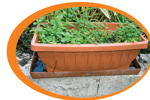
Elimina i sottovasi e, se non puoi toglierli, evita il ristagno d'acqua