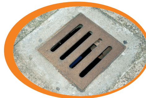
Pulisci accuratamente i tombini e le zone di scolo

Proteggiamoci dalle punture: usiamo zanzariere alle finestre, repellenti e abbigliamento adeguato quando siamo all'aperto soprattutto all'alba e al tramonto.