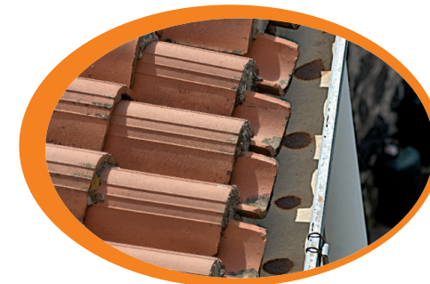
Controlla periodicamente le grondaie mantenendole libere e pulite